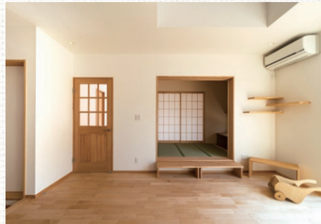
フローリングは家具に合わせメーブルを採用