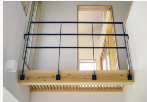
子供部屋の廊下は遊び心あるスリットの床