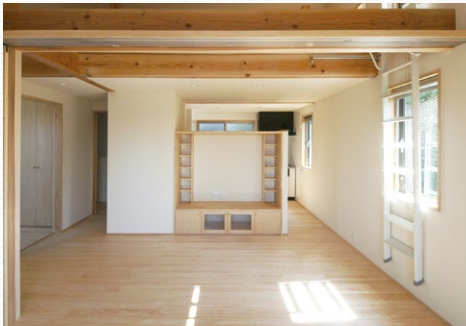
造付けのTVボードは高さを抑え、風がキッチンに吹き抜けるように配慮

窓からは雑木林の緑が 視界に入り、室内には清 涼な風がたくさん入って きます。南側には街の夜 景や富士山が見え素晴ら しいパノラマが広がります。 1階には念願だった お茶を立てられる本格的 な和室が設けられ、来客 をおもてなす準備もでき ました。