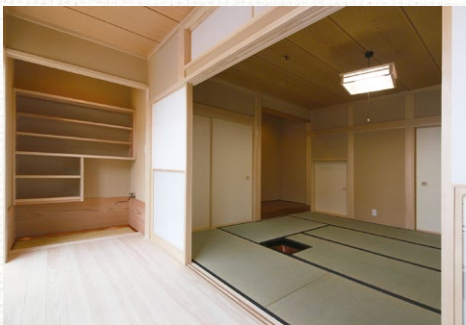
炉と水屋のある本格的な和室