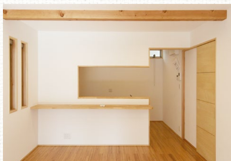
化粧梁がアクセントになったリビング・ダイニング

戸建て住宅です。バルコニーの袖壁は隣家とのプライバシーを確保すると同時に、ウインドキャッチ効果を高めて室内へ自然風を導きます。また、適度に伸びた軒先は夏の日差しを遮りながら、冬の太陽のポカポカ陽気は入るようにしました。 室内の壁にもアクセントに木の羽目板を張り、見た目だけではなく木の香りでも地域型住宅を感じていただけるようにしました。