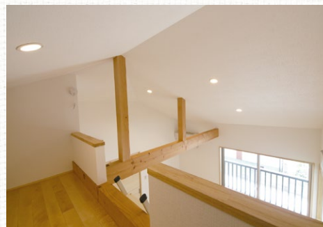
勾配天井で寝室も広々と感じます