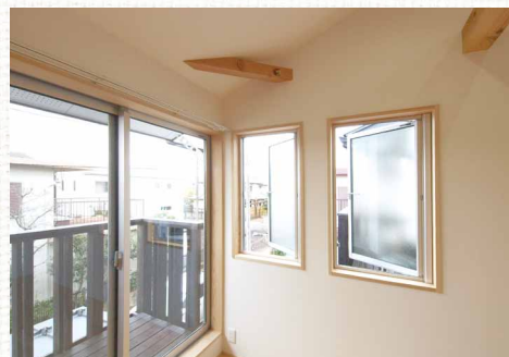
建物の微妙なずれと窓の配置がプライバシーを守るポイント