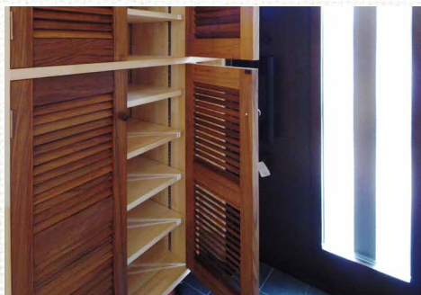
無垢のチーク材を使用した収納扉