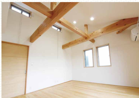
サイドトップライトは通風効果が絶大です